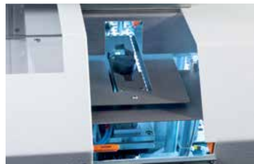
Die leicht zugängliche Probenaufnahme mit automatisch verriegelter Haube garantiert die einfache und sichere Probeneingabe.