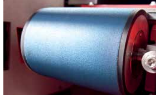
Optimierte Maschinennutzung durch Integration von Schleiftopf und Schleifband: kombiniert oder separat einsetzbar.