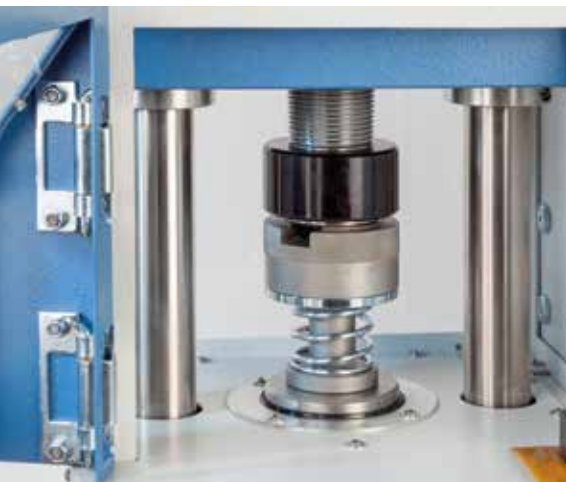
Presswerkzeug der TP 20 E

Das Probenmaterial wird manuell in das Presswerkzeug eingefüllt. Der Bediener setzt das Presswerkzeug in die Maschine ein und schließt die Sicherheitsklappe für die Ein- und Ausgabe. Bei nicht geschlossener Klappe startet die Maschine nicht.