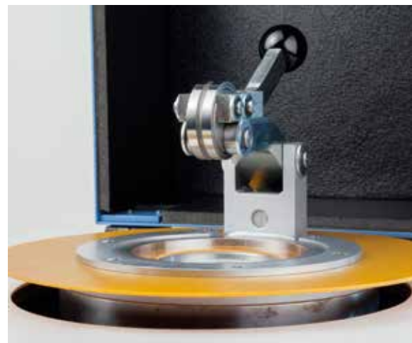
Manuelle Spannvorrichtung mit und ohne Mahlbehälter (50 ccm)