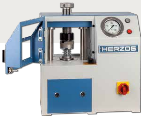
Zugang zum Presswerkzeug über die Sicherheitsklappe