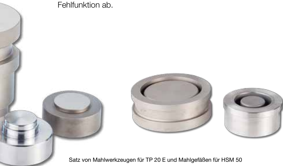
Satz von Mahlwerkzeugen für TP 20 E und Mahlgefäßen für HSM 50