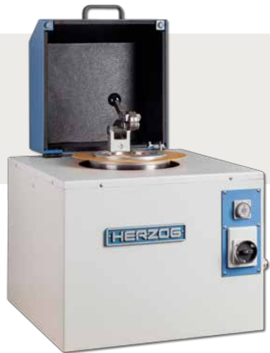
Leicht zugängliche Spannvorrichtung

Nach Schließen der Klappe wird die Maschine während des gesamten Mahlvorgangs verschlossen. Nach Beendigung des Mahlvorgangs kann das Mahlgefäß entfernt und das gemahlene Material für die weitere Verwendung entnommen werden. Die Maschine ist vollständig geschlossen, schallgedämpft und nimmt lediglich ein Mindestmaß an Bedienerzeit und Wartung in Anspruch. Sicherheitsschalter schalten die Maschine automatisch im Fall einer Fehlfunktion ab.